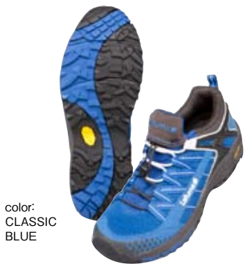
color: CLASSIC BLUE

ヨーロッパ・チャンピオンのキャリン・ヘリーやコリン・ファーヴェをはじめ、多くのトップランナーのフィードバックにより、進化を続けるラフマ。独自の機能性と最先端の技術、ヨーロッパブランドならではの洗練されたデザイン……、より速く、より快適にトレイルランナーをサポートするラフマの魅力は尽きない。