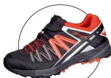
color: DARK STONE

超ロングレンジ・レース対応モデル。アッパーは3Dメッシュで通気性抜群。アウトソールVibram® ADVANCE TRAILソールを採用。つま先に保護性の高いストーンガード付き。