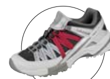
color: GRIS PERLE

通気性、防水透湿性の高いMスカイレースOTのレディースモデル。機能はメンズ同様のスペックで、女性専用のデザインを採用している。