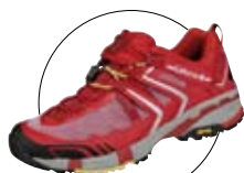
color: ROUGE VERMILLON